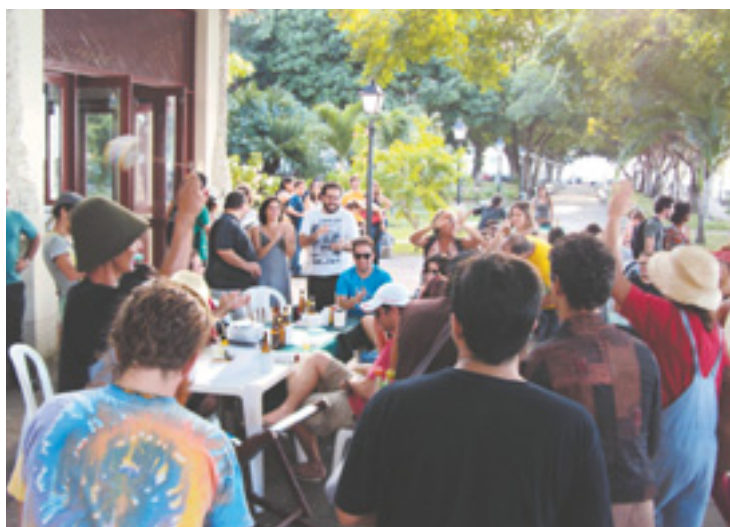
Depois de ocupar espaços alternativos, o evento firma parceria com a Escola Porto Iracema, braço de formação do Instituto Dragão do Mar